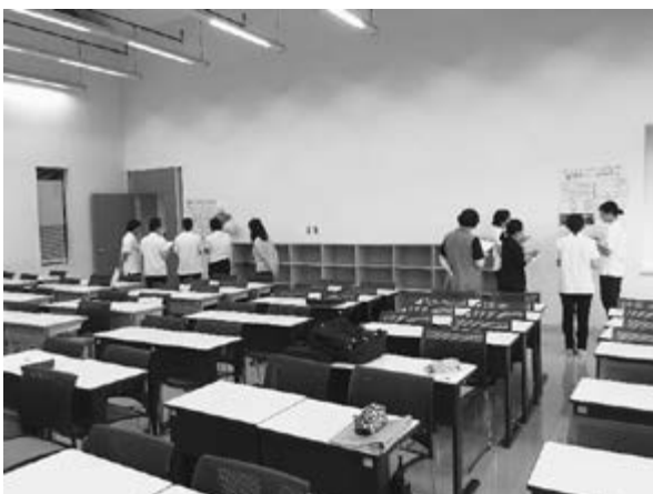
写真1 ポスターツアーの様子

異なるポスターを作成した者同士で新しいグループ（ツアーグループ）を作り、自分が作成した実習施設のポスターについて他の実習グループメンバーに説明をする。各ツアーグループに実習グループメンバーが最低1～2名入るように再編成した（図2,写真参照）。ポスターツアーの発表