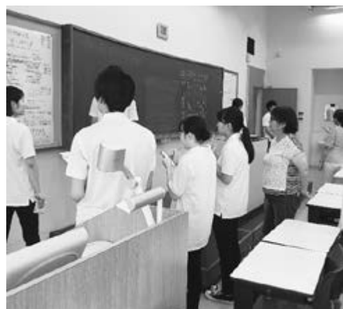
写真2 ポスターツアーの様子